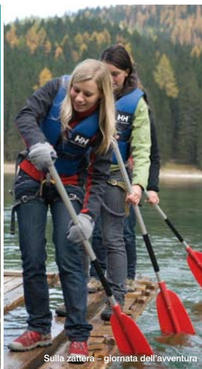
Sulla zattera – giornata dell'avventura