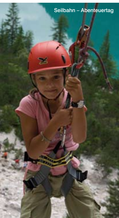
Seilbahn – Abenteuertag