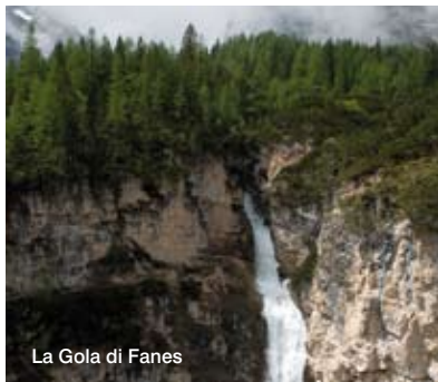
La Gola di Fanes