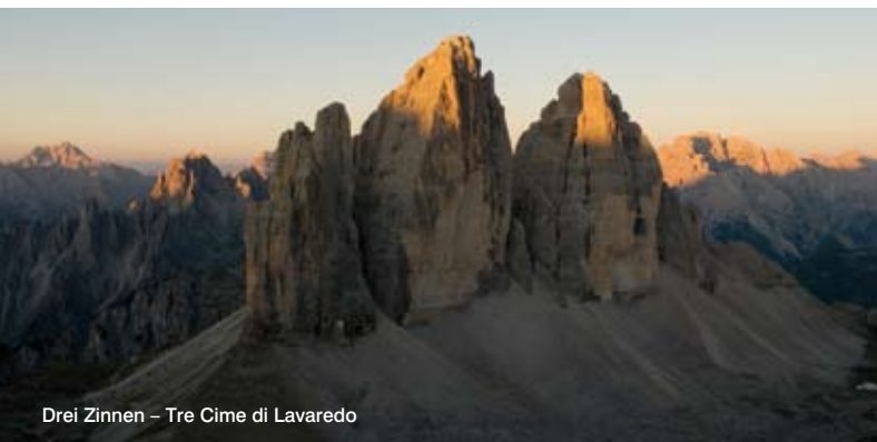
Drei Zinnen – Tre Cime di Lavaredo