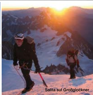
Salita sul Großglockner